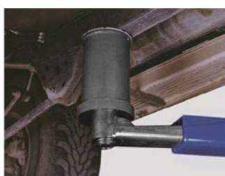
► OPCIONALES Opcional 4 x 4.