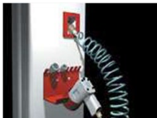
► OPCIONALES Soporte herramientas.