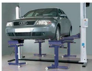
► OPCIONALES Soporte alineador direcciones.