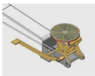
► OPCIONALES ExpressPad como innovación para una mayor ergonomía en el trabajo diario con varias posiciones.