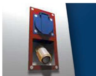
► OPCIONALES Enchufe de aire y luz.