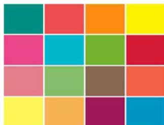
► OPCIONALES Personalización de colores.