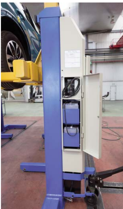
Detalle de la ubicación de las baterías

Cada columna funciona a 24 V en corriente continua. Dispone de dos baterías de 12V conectadas en serie y de un cargador de baterías. Para recargarlas basta con conectar el enchufe de 220 V a la red eléctrica del taller. Cada cargador de batería porta un pulsador LED, que facilita información del nivel de carga, según el color que emita. Mediante una leyenda en forma de círculo alrededor del LED, los diferentes colores están asociados a un porcentaje de carga.