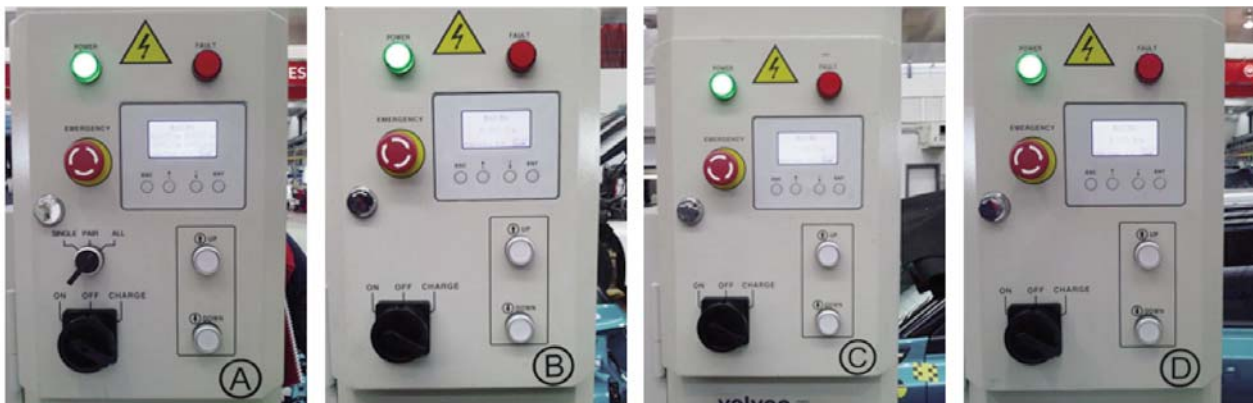
Columna A: Columna maestra