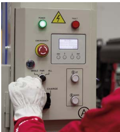
Tecla selectora de columnas

Esta información sobre el modo elegido también se muestra en cada pantalla.