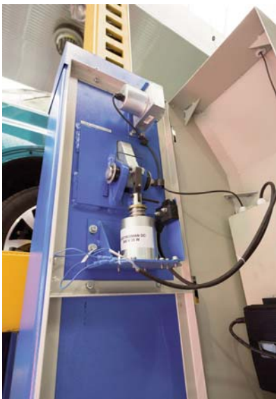
Detalle del trinquete mecánico

Para conseguir un funcionamiento correcto, adoptando las medidas de seguridad adecuadas, es necesari-