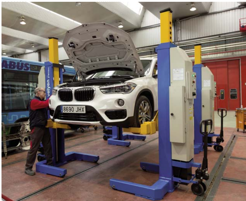
Partes de la columna elevadora